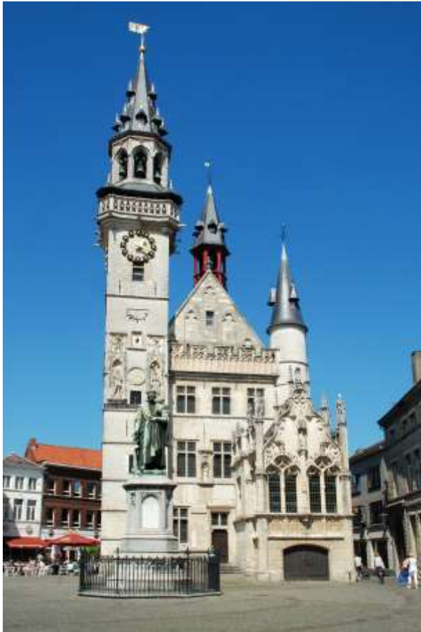
Schepenhuis Aalst, c.1225