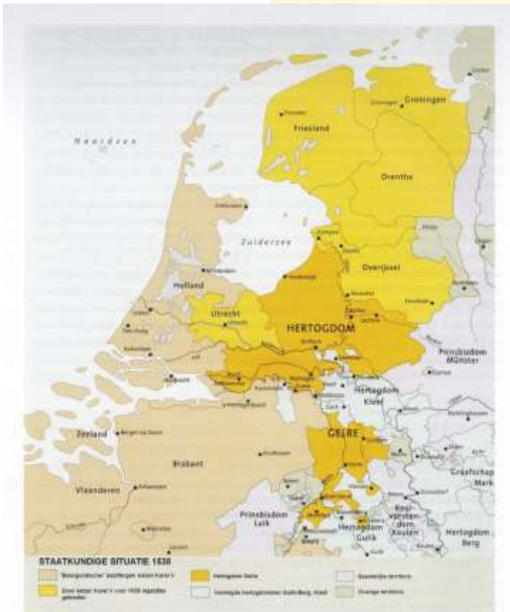
Gelre ingeklemd tussen Bourgondisch-Habsburgse Nederlanden en de hertogdommen Kleef en Gulik. Naar een kaart uit Het Hertogdom Gelre, pag. 469.