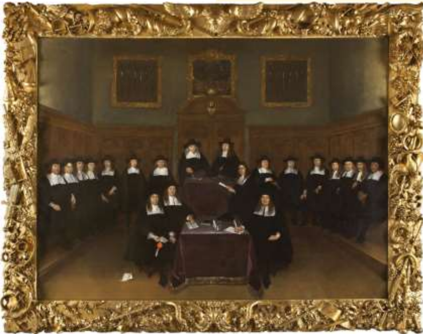
Magistraat Deventer 1667, Gerard ter Borch