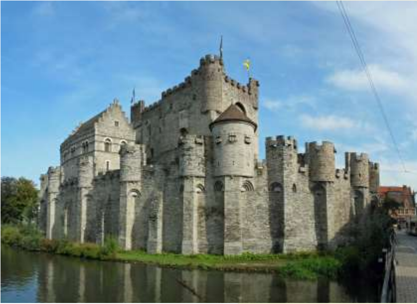
Gravensteen, Gent, ca. 1000