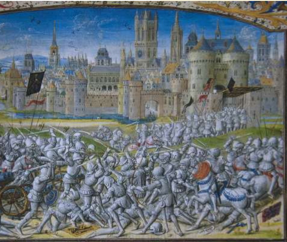
Slag op het Beverhoutsveld 5 mei 1382: Gent verslaat hertog