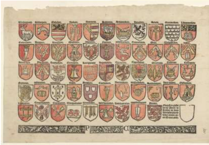
Wapenschilden van 53 Gentse gilden, 1524