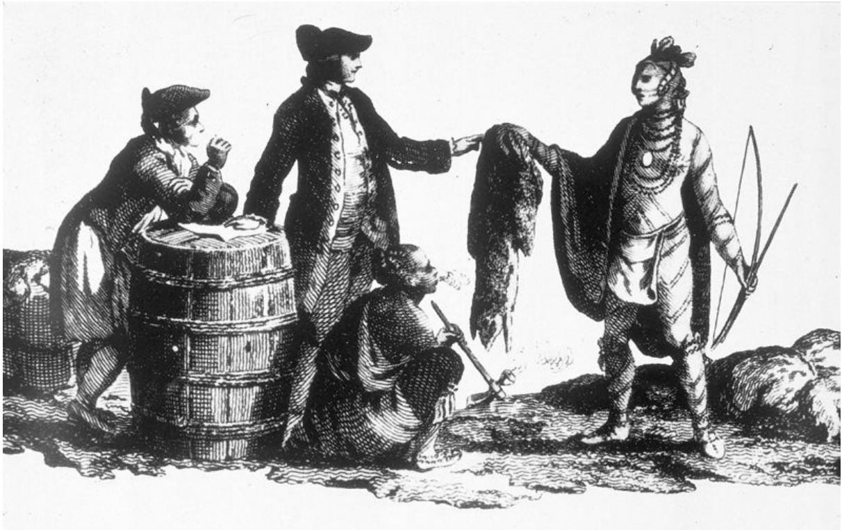
Native American handelt beverhuiden met Engelse kolonisten