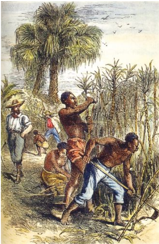
Tot slaaf gemaakt aan het werk op een suikerplantage, +/- 1670