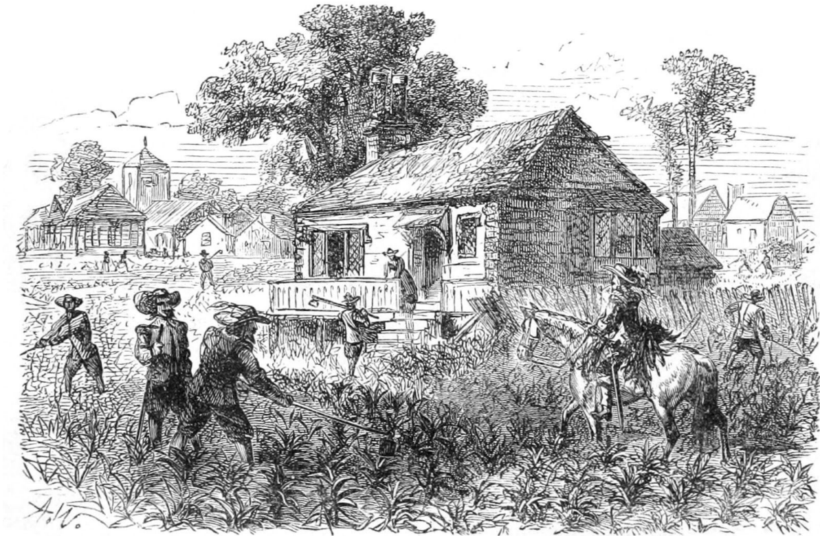
Cultiveren van tabak in Jamestown, 1615