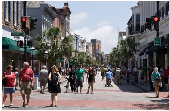
Charleston, Verenigde Staten