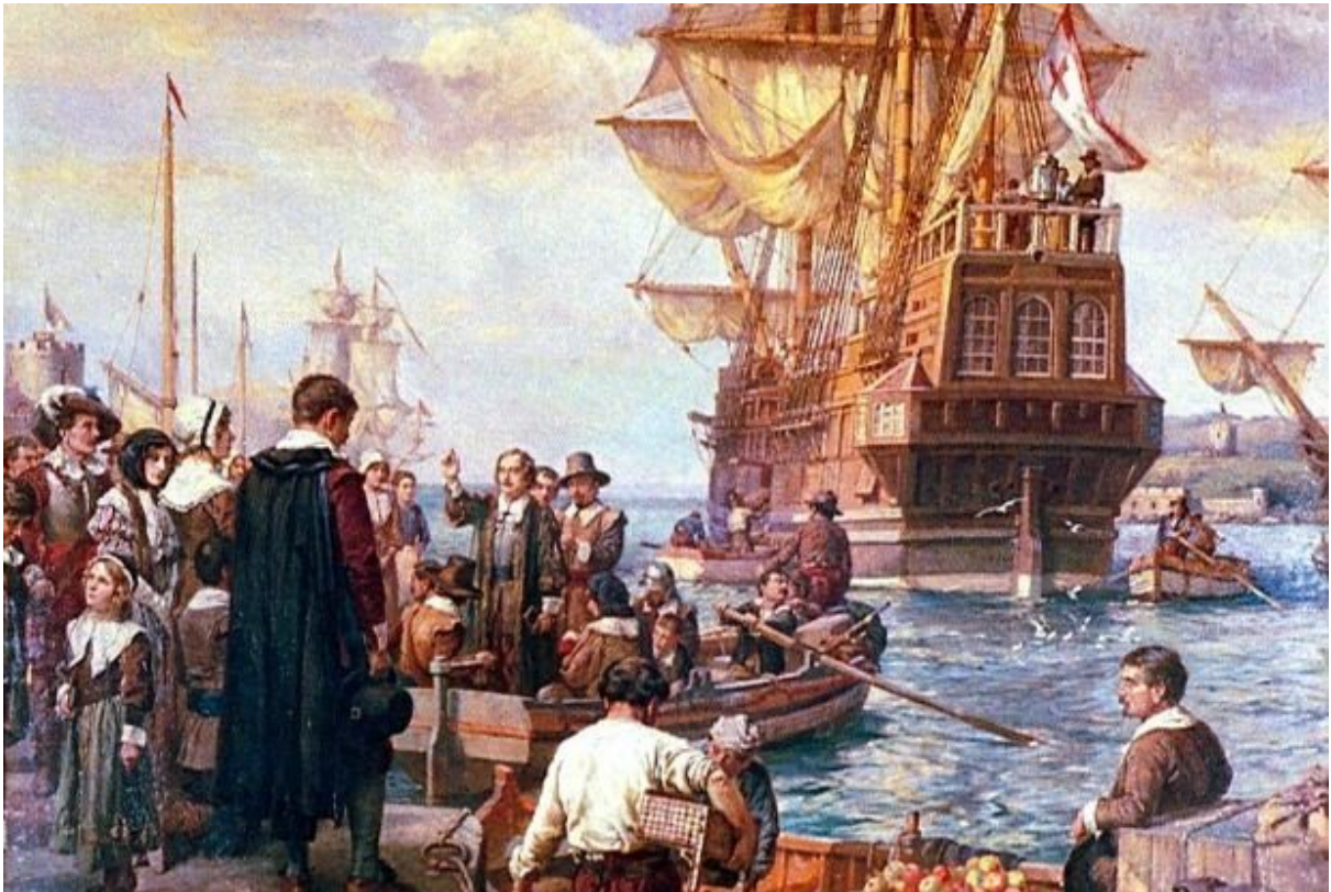
Pilgrim Fathers verlaten Engeland in de Mayflower , 16 september 1620