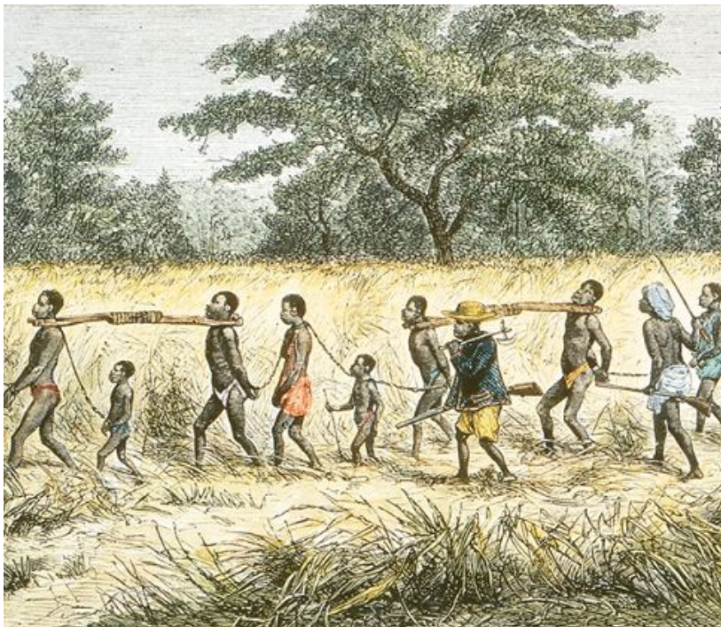
Afrikanen werden in het binnenland gevangen genomen en moesten naar de kust lopen voordat ze naar de Amerikaanse koloniën werden vervoerd.