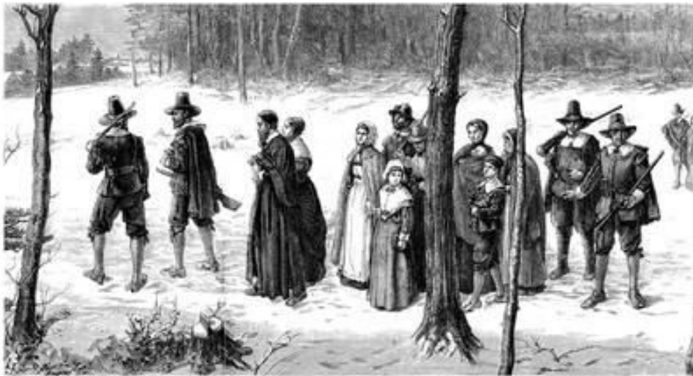
Pilgrim Fathers op weg naar de kerk