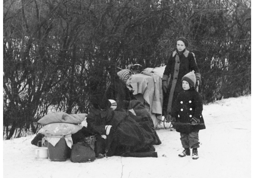
In Silezië (nu: Zuid-Polen) wacht een Duitse familie op wagens voor de vlucht naar het westen, januari 1945.

Bij terugkomst in Gäbersdorf — ‘Roof, moord, verkrachting en veel ander menselijk leed waren ook na het einde van de oorlog aan de orde van de dag. We waren slaven van de nieuwe heersers. Ziekte en hongersnood bleven niet uit. Het halve dorp stierf aan tyfus. Ik moest zonder hulp van artsen, medicijnen en eten mijn familieleden verzorgen. Mijn oma, mijn 17-jarige zus en mijn tante stierven. Alleen mijn moeder overleefde het; ze verkeerde in een verschrikkelijke toestand.’