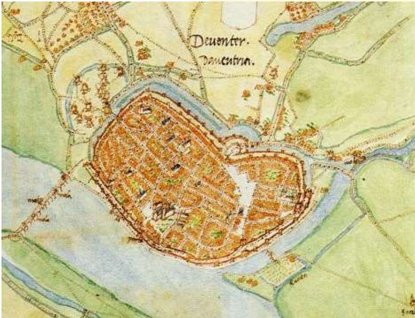
Deventer ca. 1560