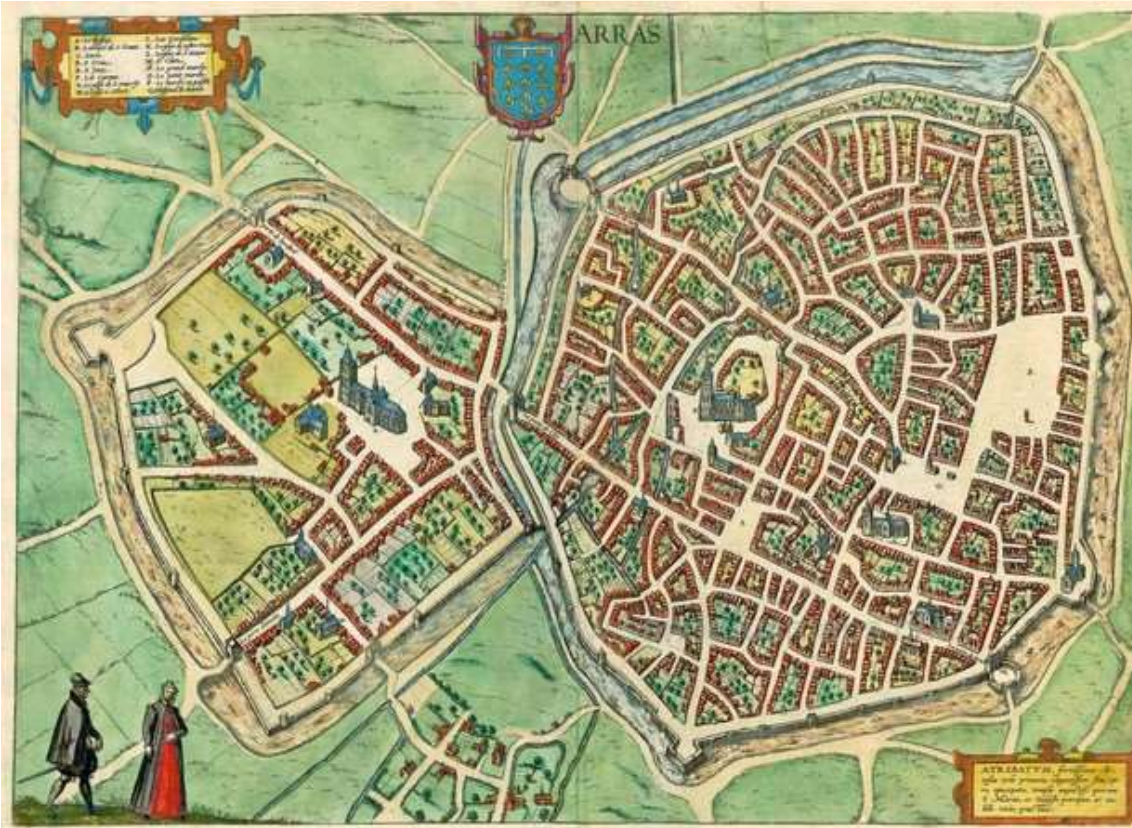
Arras ca. 1575 © C. Plantijn